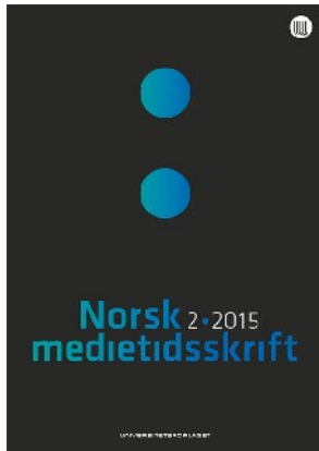
Norsk Medietidsskrift, årgang 22, nr. 2-2015, s. 1–6 ISSN online: 0805-9535