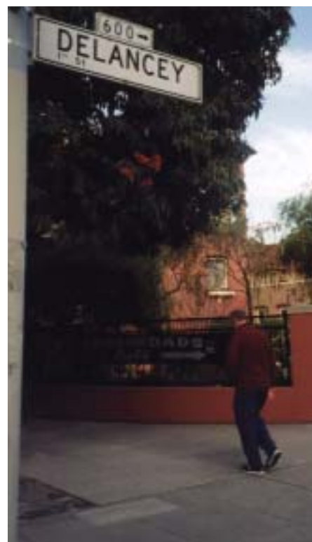
Delancey Street Foundation i nummer 600 i gata med samme navn fyller et helt kvartal i det fasjonable havneområdet Embarcadero i San Fransisco.