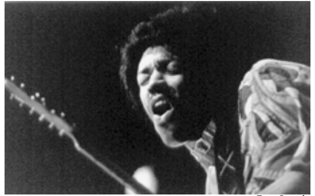
Jimi Hendrix 1969

Allmøtet erklærte raskt Et sted å være som rusfritt. I en tid da ungdomsopprør var synonymt med liberale rusmiddelholdninger var dette oppsiktsvekkende. At vedtaket var naivt og slett ikke lot seg opprettholde, er en annen historie. Som et ekko i dag leser jeg i Aftenposten at boligokkupanter i Hausmanns-